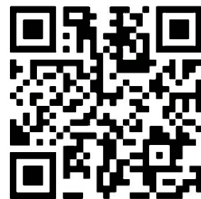
申込みサイト QR コード

1984年 京都府亀岡市生まれ。専門学校の職員として勤務後、2012年9月に飲食事業や不動産事業を行う「株式会社minitts」を設立。1日100食限定をコンセプトに、美味しいものを手軽な値段で食べられるお店「佰食屋」を行列のできる人気店へ成長させる。ランチ営業のみ、完売次第営業終了という飲食店の常識を覆す経営手法で、飲食店でのワークライフバランスとフードロスゼロを実現し、日経WOMANウーマンオブザイヤー2019大賞等数々の賞を受賞。