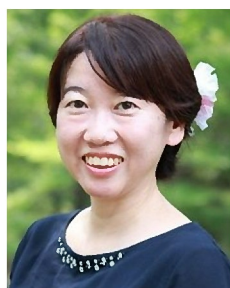
小野税務会計事務所 所長 税理士